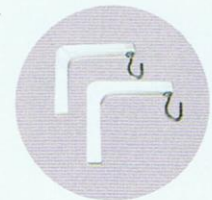
ขาแขวนจอ