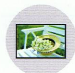
Fixed Projection Screen